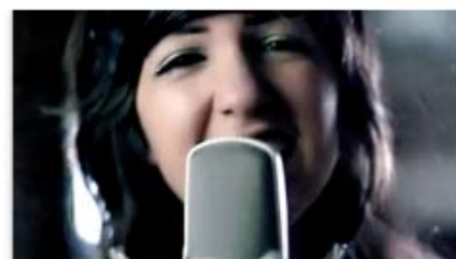
TeraBrite - "In Honor of Her Heart"